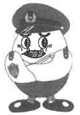
埼玉県警察マスコット 「ポッコくん」