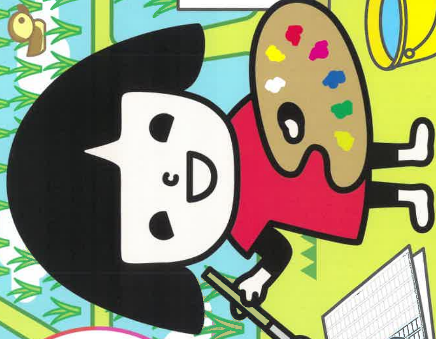
実味ちゃん

毎日のごはんでおいしかったことや 家族とのコミュニケーション、 お米・ごはん食に関する思いや 考えたことなどを素直な気持ちで 自由に表現して下さい。